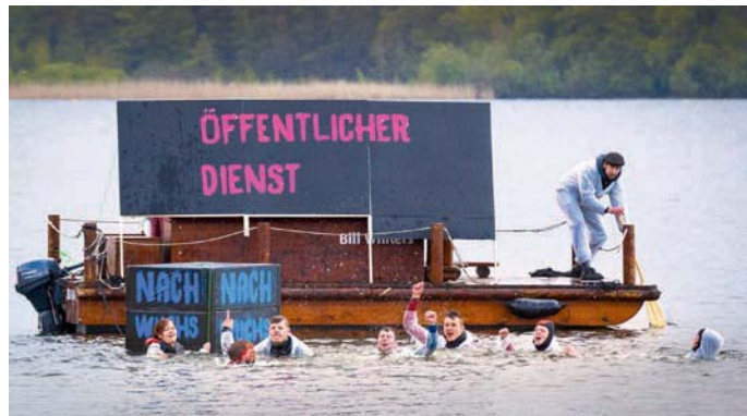
Aktion der ver.di Jugend in Potsdam: Ohne Übernahme geht der Nachwuchs baden